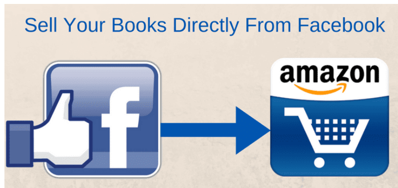
Afbeelding 3: Koppeling Facebook – Amazon

Personalisering is een belangrijke nieuwe trend in e-commerce, en persoonlijker dan social shoppen wordt het niet. Voor veel mensen is winkelen immers ook een sociale activiteit, en geeft het advies van een goede vriend(in) vaak de doorslag in het aankoopbeslissingsproces. En dus sluit Facebook in 2010 een deal met Amazon, waardoor Facebook-leden hun persoonlijke profiel aan een Amazon-account kunnen koppelen, en het vriendelijk koopadvies zo ook online beschikbaar is. En natuurlijk is het ook erg handig dat je niet alleen precies weet wanneer je vrienden jarig zijn, maar ook een praktisch antwoord hebt op de vraag: wat zullen we voor cadeautje kopen?