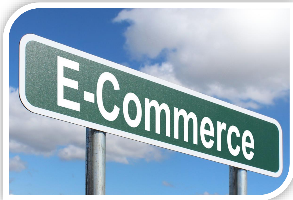
Afbeelding 1: E-commerce, handelen via het internet

Een jubileum gaat vaak hand in hand met een terugblik. Vandaar dit overzicht van de e-commerce geschiedenis in tien mijlpalen. Je zal er uiteraard diverse oude bekenden in herkennen, maar ook een paar nieuwe spelers die ons een prachtig uitzicht bieden op een florissante en conversiegevolle toekomst.